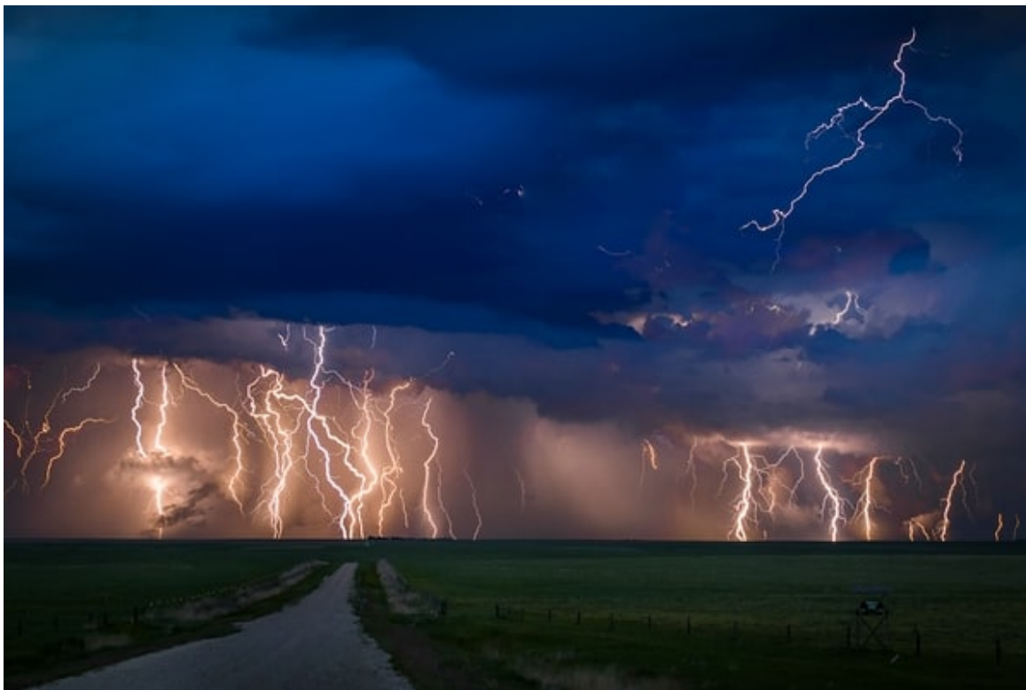
Licht und Wetter in der Landschaftsfotografie