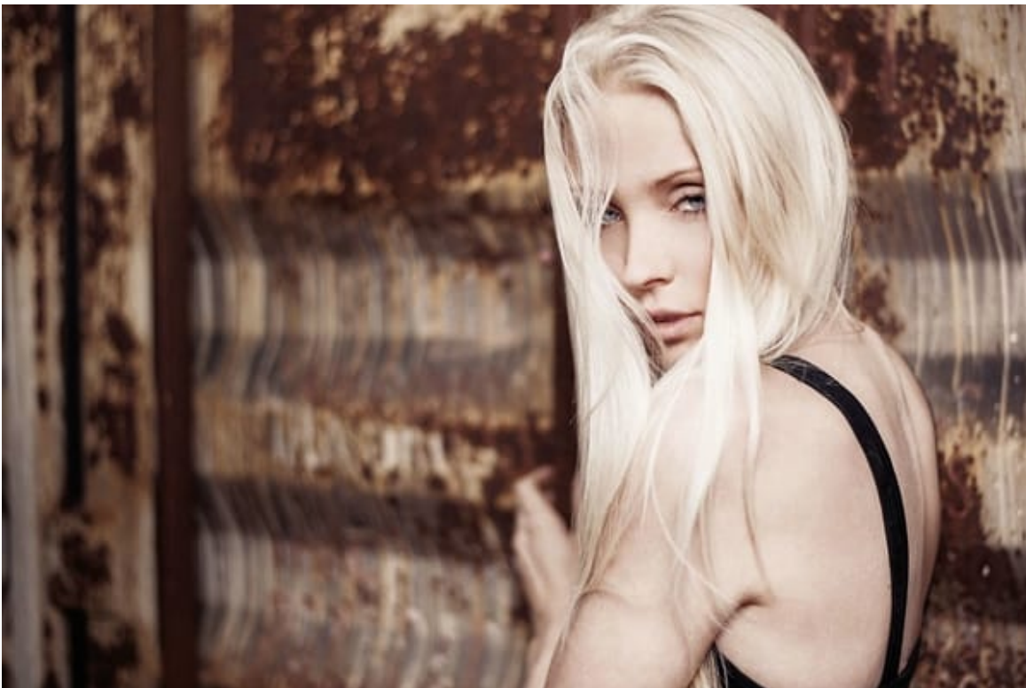
Mobiles Blitzen und Lichtsetzung

„kreative Aufnahmetechniken in der Landschaftsfotografie“ und Pavel Kaplun „Tierfotografie im Zoo“ zu den beliebtesten Klassikern im Kursprogramm des Foto-Festivals.