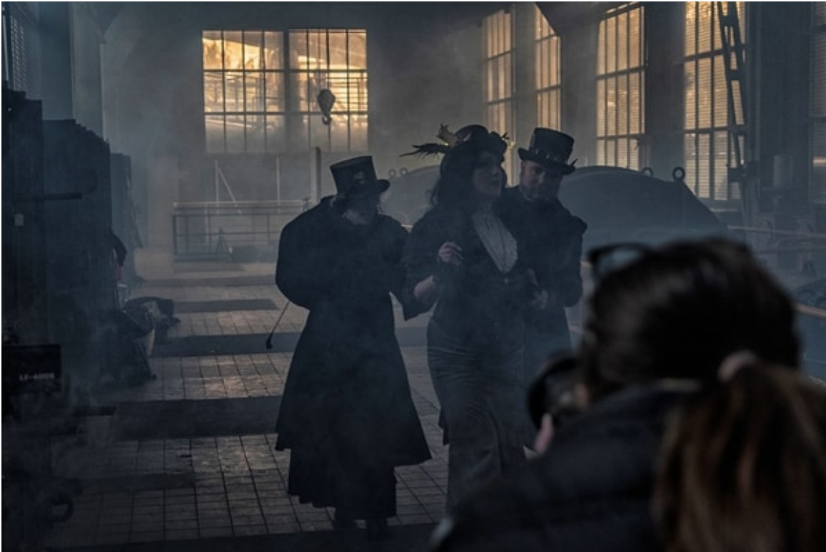
Jack the Ripper meets Post Victorian Industrial

https://www.nikon-fotografie.de/2019/11/28/workshop-seminar-photo-adventure2020/