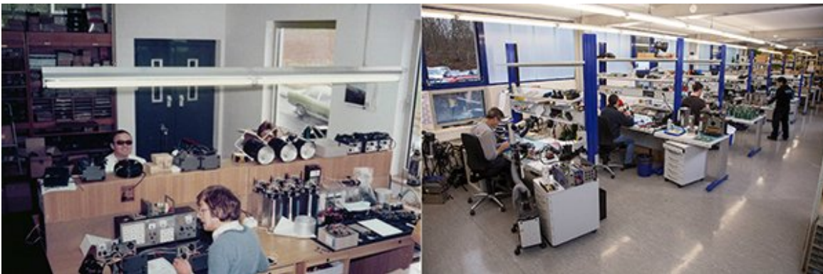
li: Servicebereich 1980 | re: Servicebereich heute

Im Falle des aktuellen Hensel EH-Systems ist der Anschlussdurchmesser seit über 30 Jahren unverändert. So schont man nicht nur unsere Umwelt, sondern auch die eigene Geldbörse.