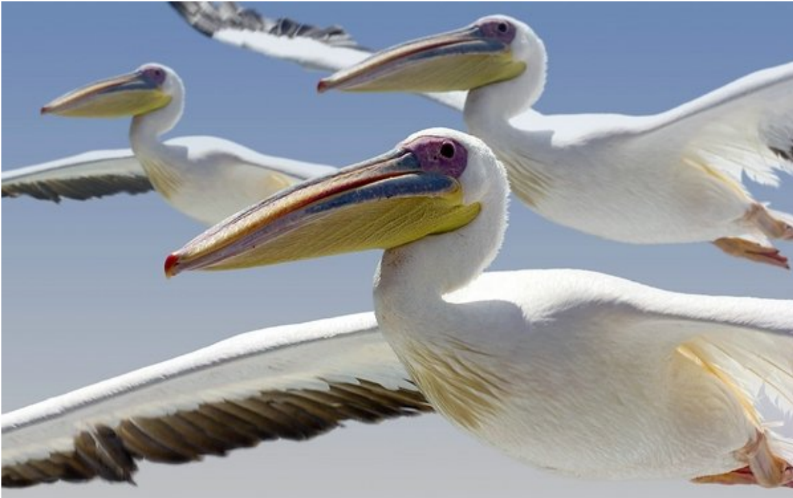
Pelikane Namibia

URL: https://www.nikon-fotografie.de/2019/01/23/im-interview-kalenderautor-olaf/