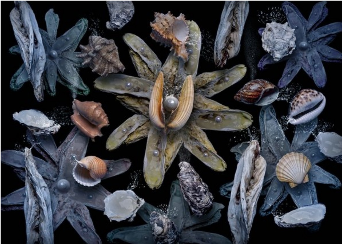
Mertensia maritima

URL: https://www.nikon-fotografie.de/2019/01/23/im-interview-kalenderautor-olaf/