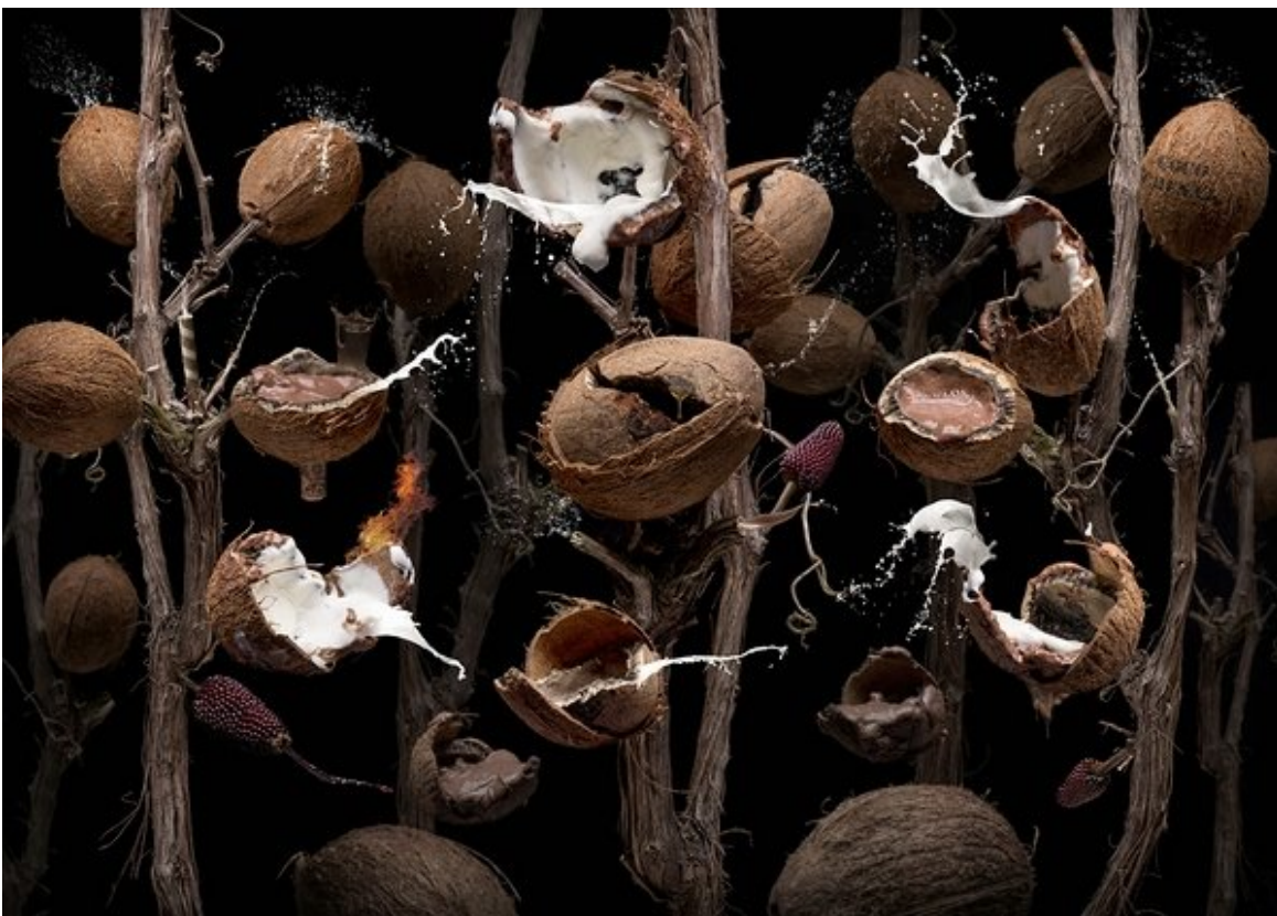
Coco nutellae

Ein zweiter guter Rat: nicht bereits Bestehendes zu kopieren, sondern versuchen, etwas wirklich Neues zu erschaffen – dabei aber nicht dauernd und zwanghaft dem Drang zu verfallen, „richtige“ Kunst machen zu wollen.